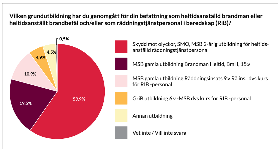
Figur 2. Medlemmarnas utbildning